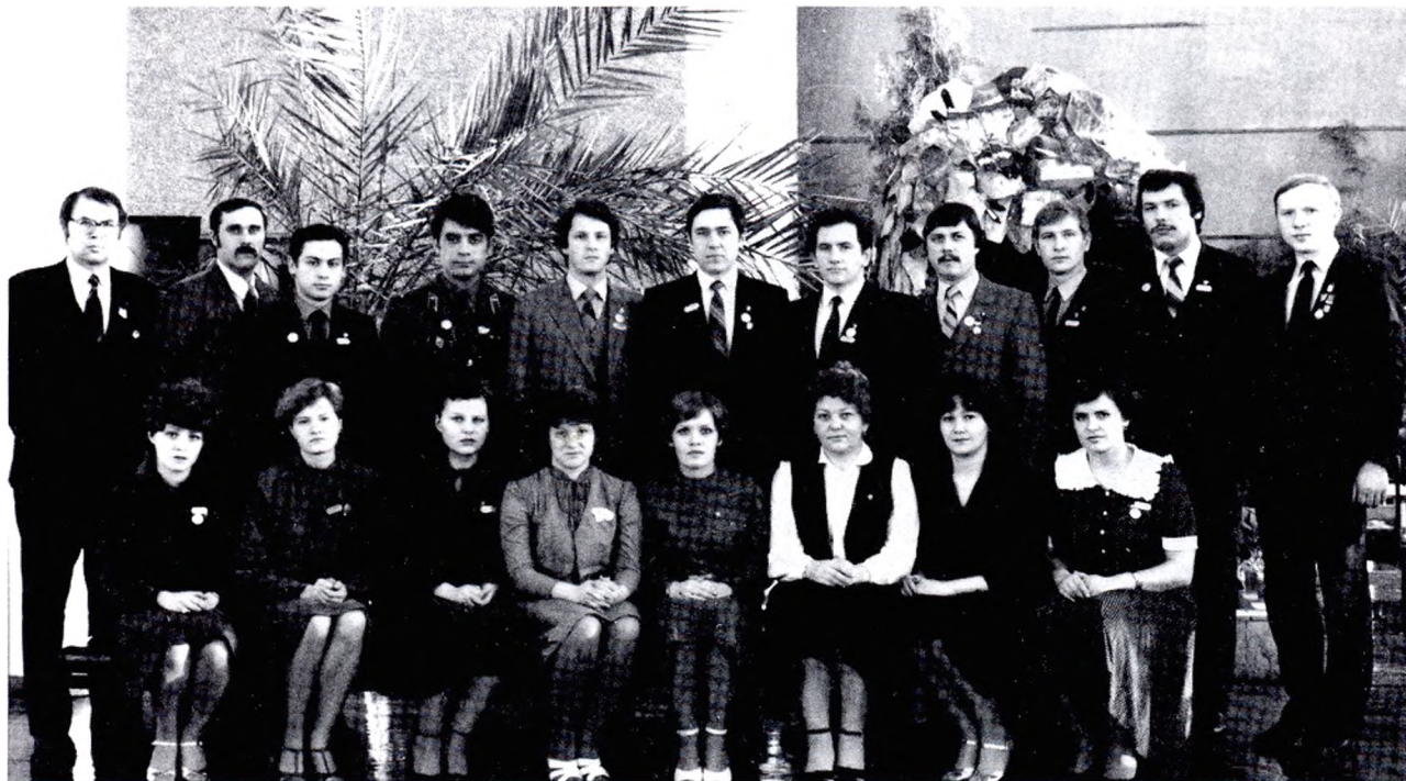
Делегаты областной комсомольской конференции от г. Свердловск-45 (1985 г.)