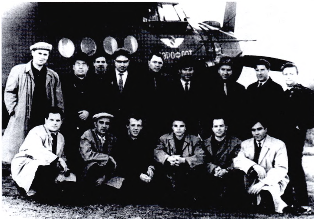
Делегация города Свердловск-45 перед вылетом в г. Златоуст-36