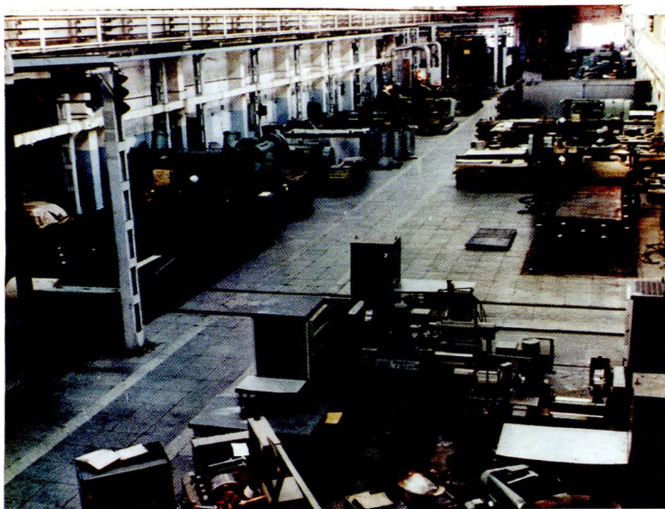
Здание заготовительного цеха (современный вид)