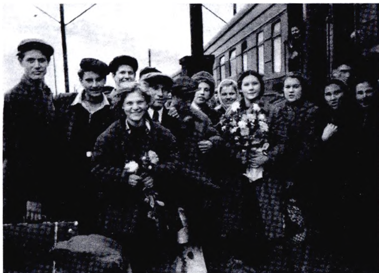
Первые строители на ж/д вокзале