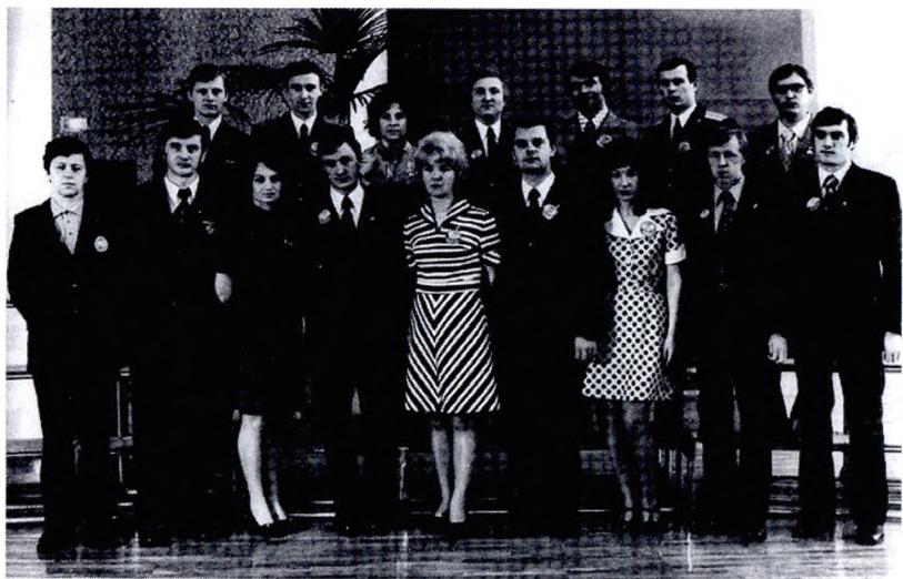
Делегаты от г. Лесного на XX областной комсомольской конференции