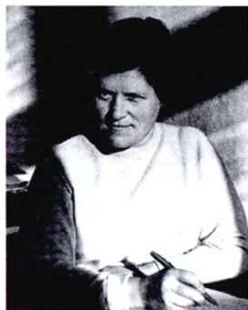
М.А. Кремлева