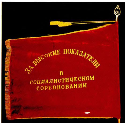
Переходящее Красное знамя ЦК ВЛКСМ и Министерства среднего машиностроения СССР, оставленное на вечное хранение Лесной городской комсомольской организации