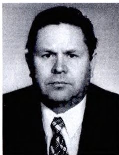
П.С. Коротовских