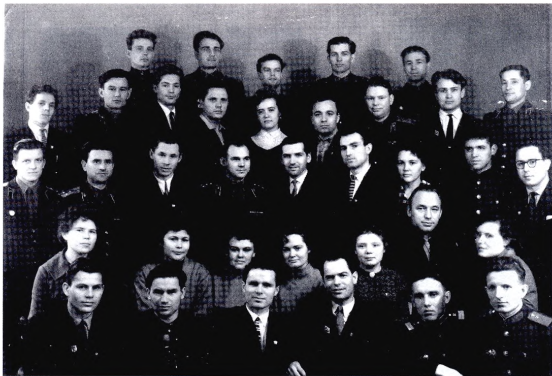
Делегации городов Свердловска-44 и Свердловска-45 на областной комсомольской конференции