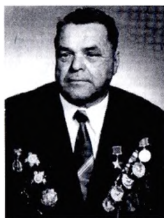
В.Н. Сиротин — первый юрисконсульт завода