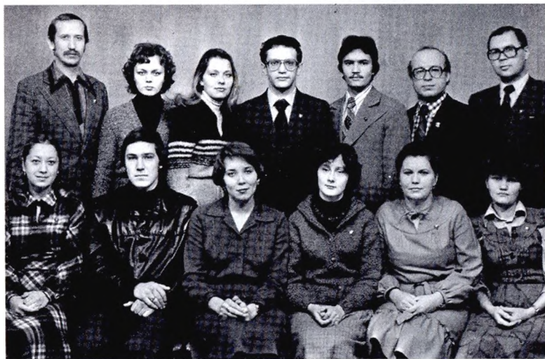
Освобожденные комсомольские работники 1980-х гг.