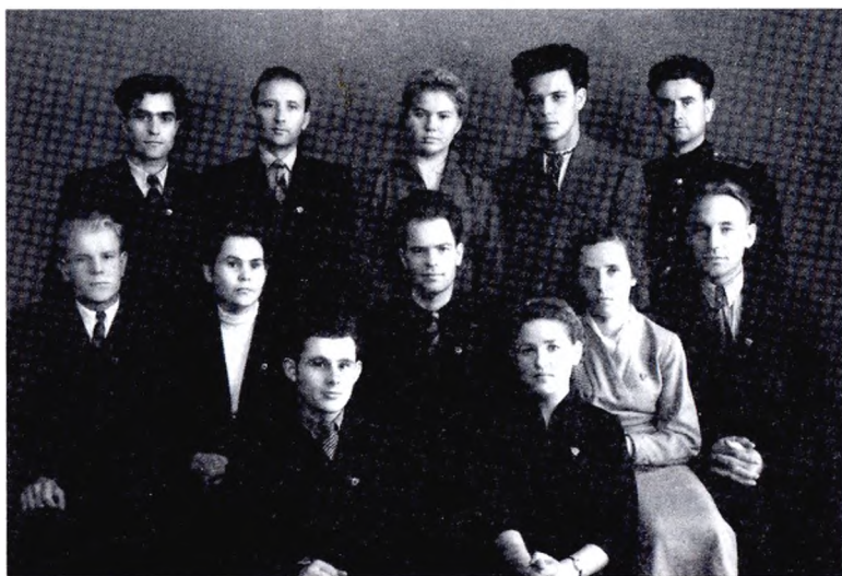
Комсомольский актив г. Лесного (1957 г.)