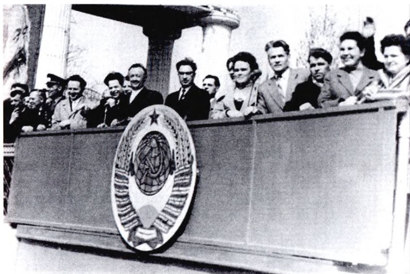
На трибуне руководители города (1 мая 1964 г.)