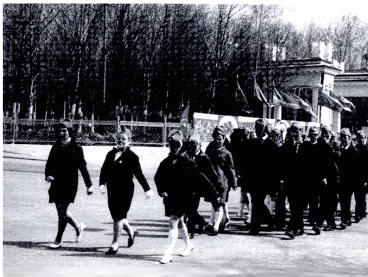
Парад, посвященный 50-летию пионерии