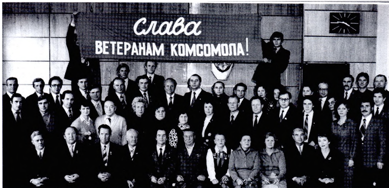
Памятное фото ветеранов комсомола (октябрь 1983 г.)