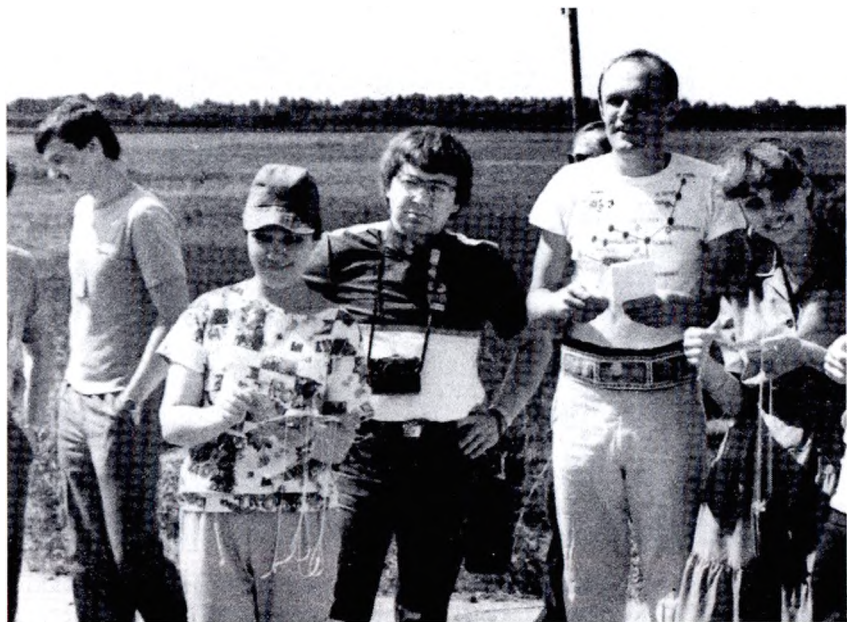
На фестивале «Каменный пояс дружбы» г. Свердловск-45 (1985 г.)