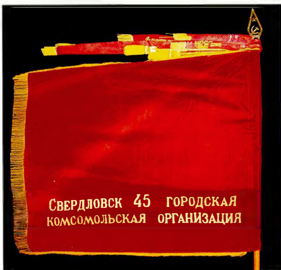
Знамя городской комсомольской организации г. Свердловск-45