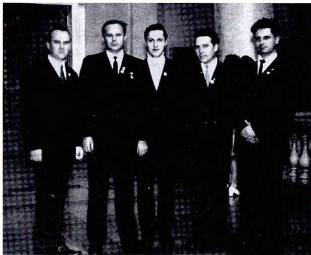
Освобожденные комсомольские работники (1972)