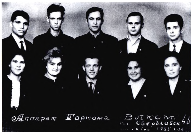
Аппарат ГК ВЛКСМ (1965 г.)