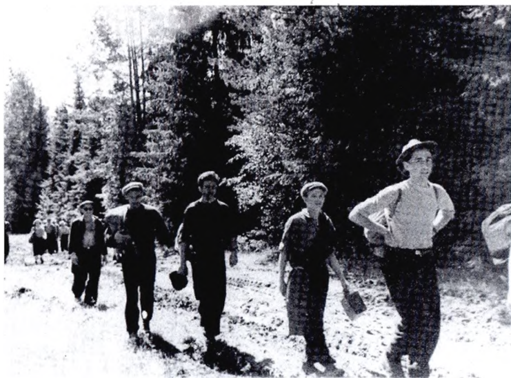
Турпоход участников клуба «Меридиан» на гору Качканар