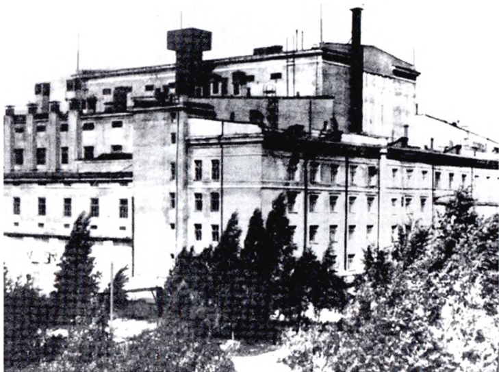
Здание цеха № 1 завода «Электрохимприбор»