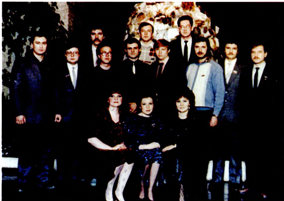
Делегаты от г. Лесного на Свердловскую областную конференцию (1991 г.)