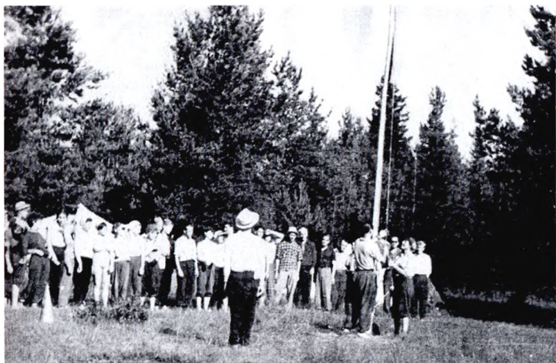
Открытие выездного семинара комсомольского актива (1958 г.)