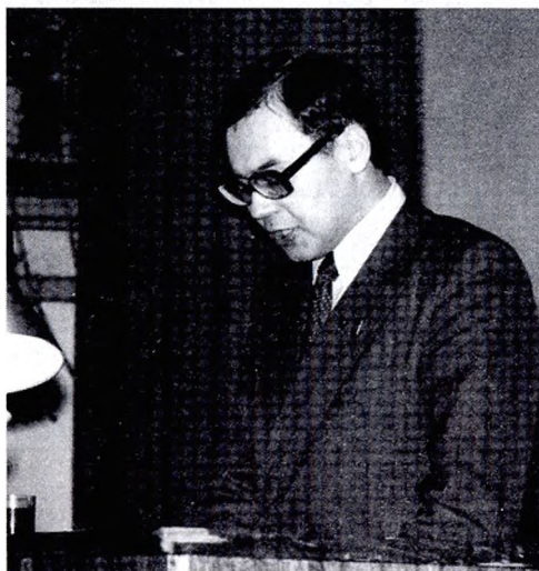
Первый секретарь ГК ВЛКСМ с 1980 по 1981 гг. О.Н. Завгородний