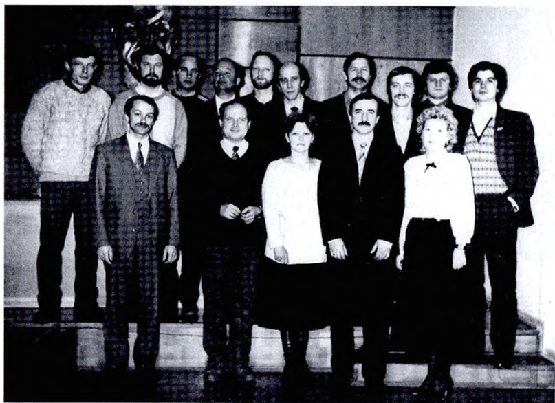
НТТМ «Дельта» (1988 г.)