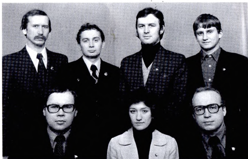
Члены комитета ВЛКСМ завода «ЭХП» (1980 г.)