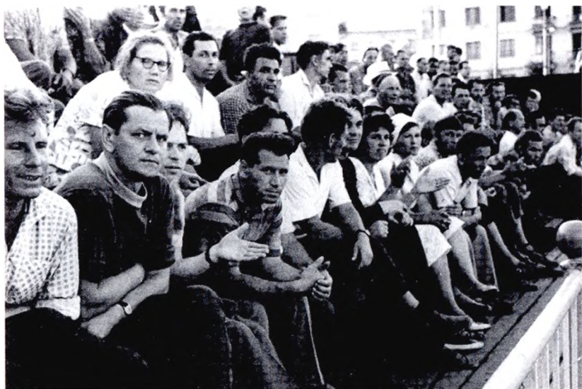
На открытии стадиона «Факел»