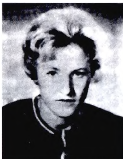
Людмила Волчкова