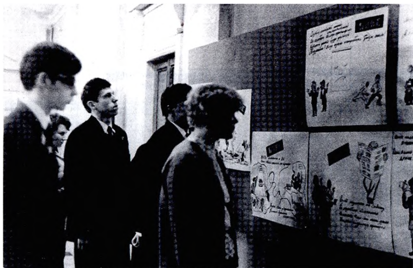
В перерыве комсомольской конференции, у стенда «БОКС»