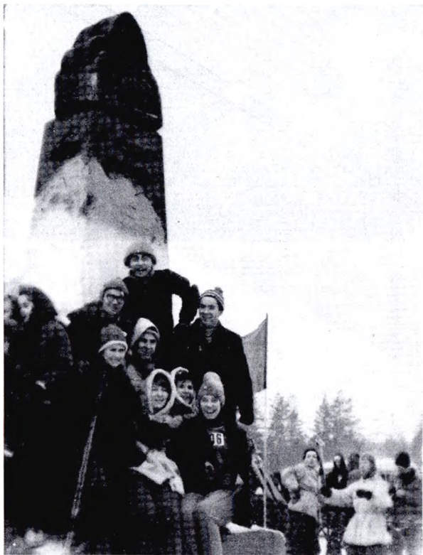
Команда турклуба «Меридиан» на Всесоюзных соревнованиях по спортивному ориентированию (1962 г.)