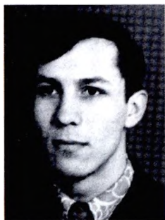
И.И. Ключников