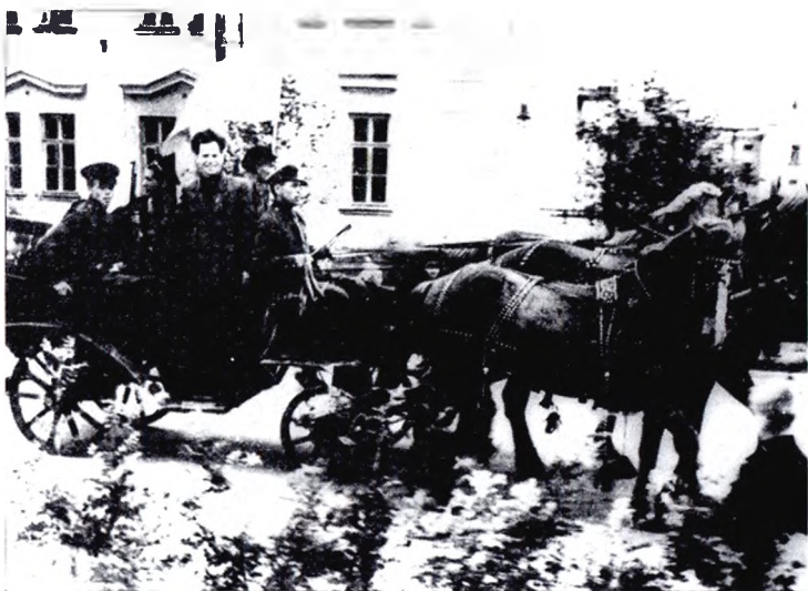
В день открытия I городского фестиваля молодежи