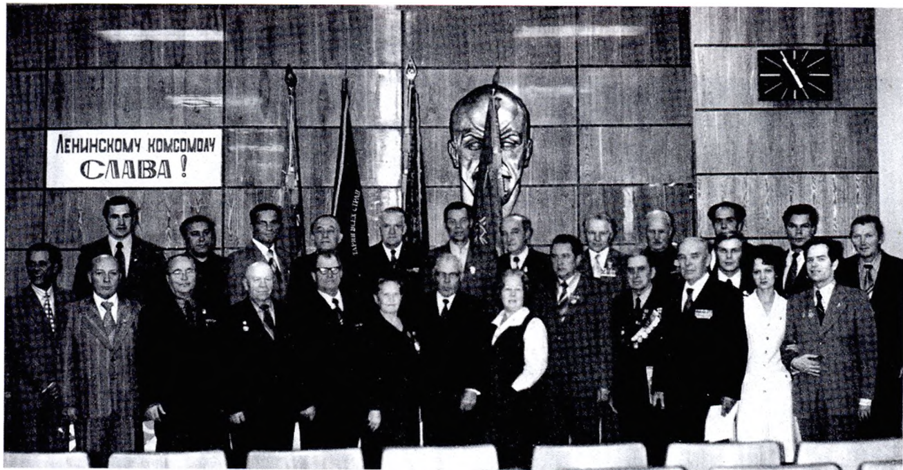
Ветераны комсомола