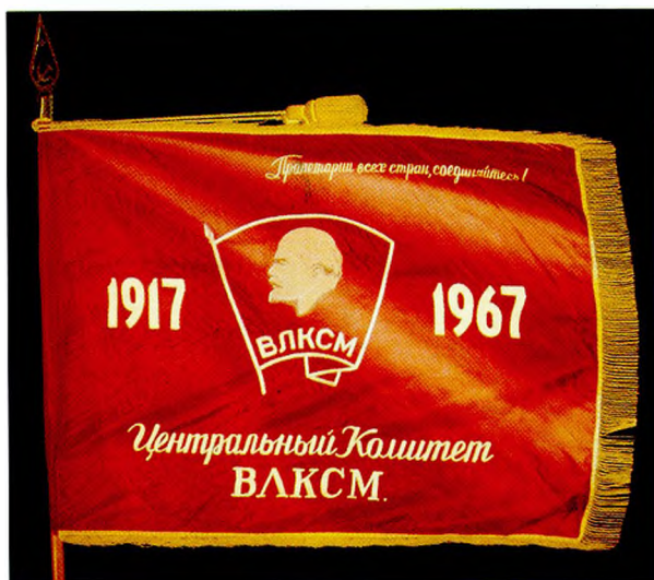
Юбилейное Памятное Красное знамя ЦК ВЛКСМ, врученное Лесной городской комсомольской организации на вечное хранение