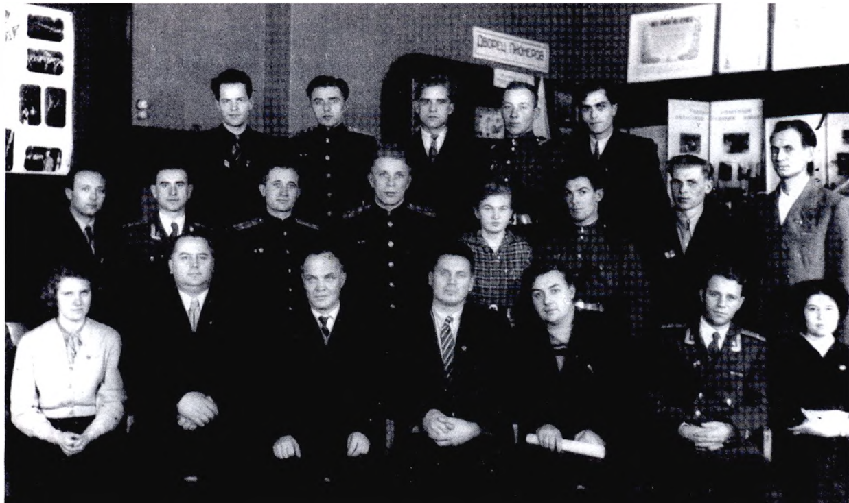
Делегаты областной комсомольской конференции (1958 г.)