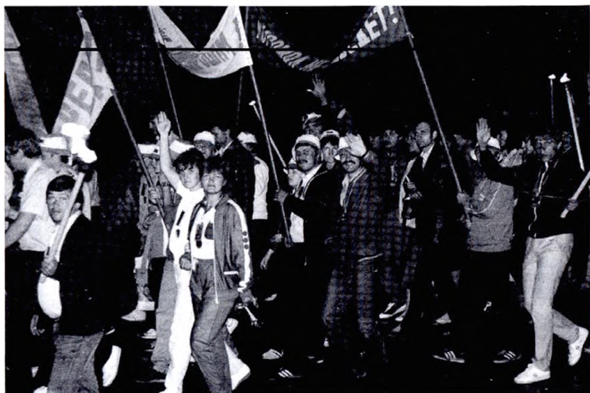
Факельное шествие на фестивале «Каменный пояс дружбы» г. Свердловск-45 (1985 г.)