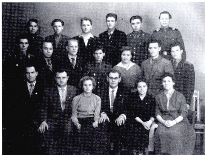
Делегаты от Лесной комсомольской организации на Свердловской областной отчетно-выборной конференции