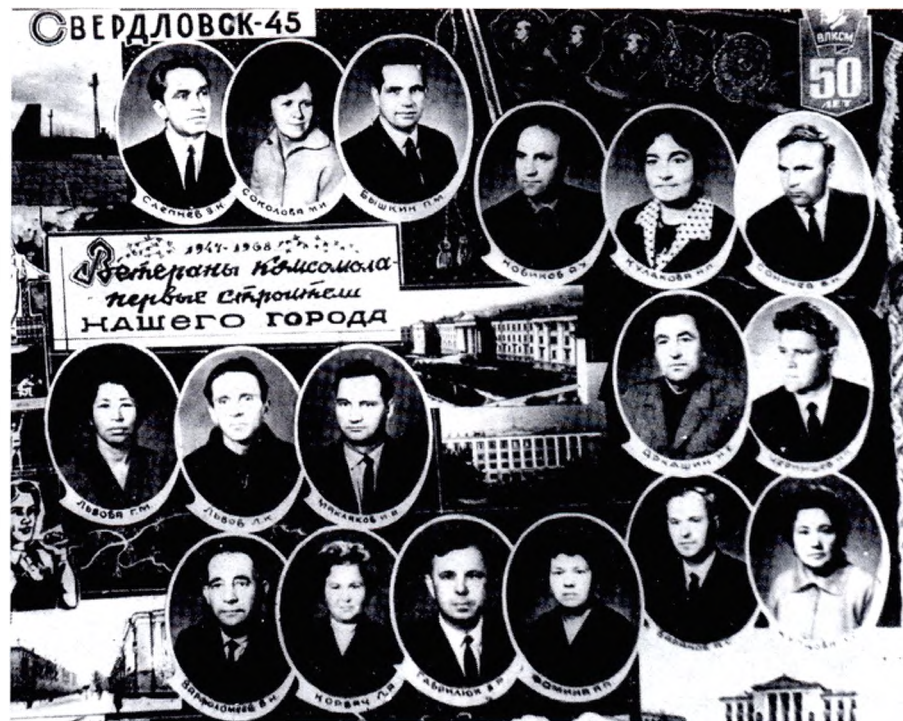
Ветераны комсомола — первые строители города