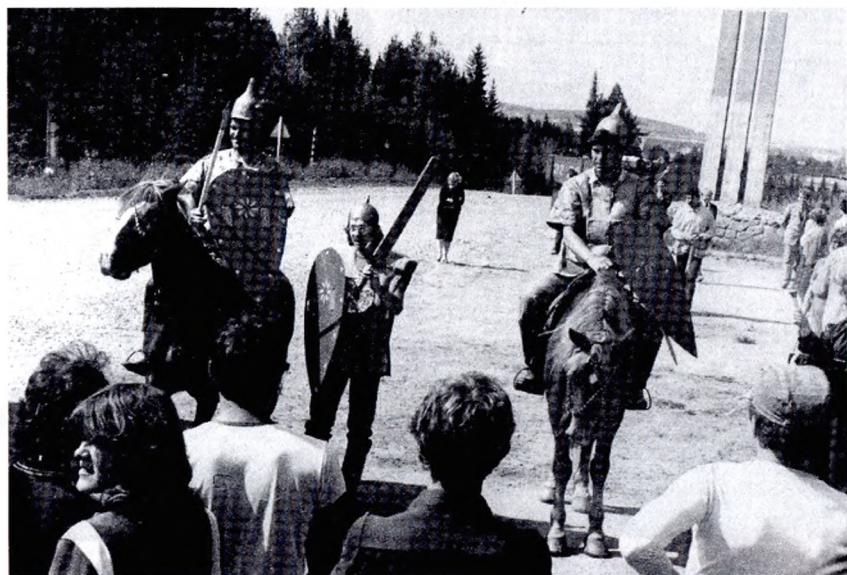
На фестивале «Каменный пояс дружбы» г. Свердловск-45 (1985 г.)