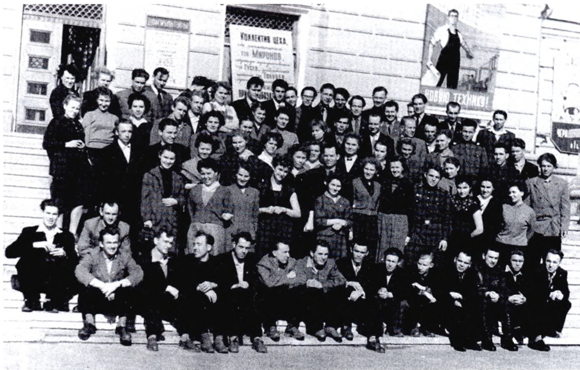
Делегаты I комсомольской конференции