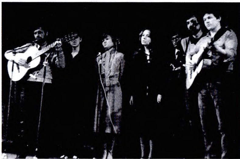
Клуб самодеятельной песни «Меридиан» на открытии Грушинского фестиваля