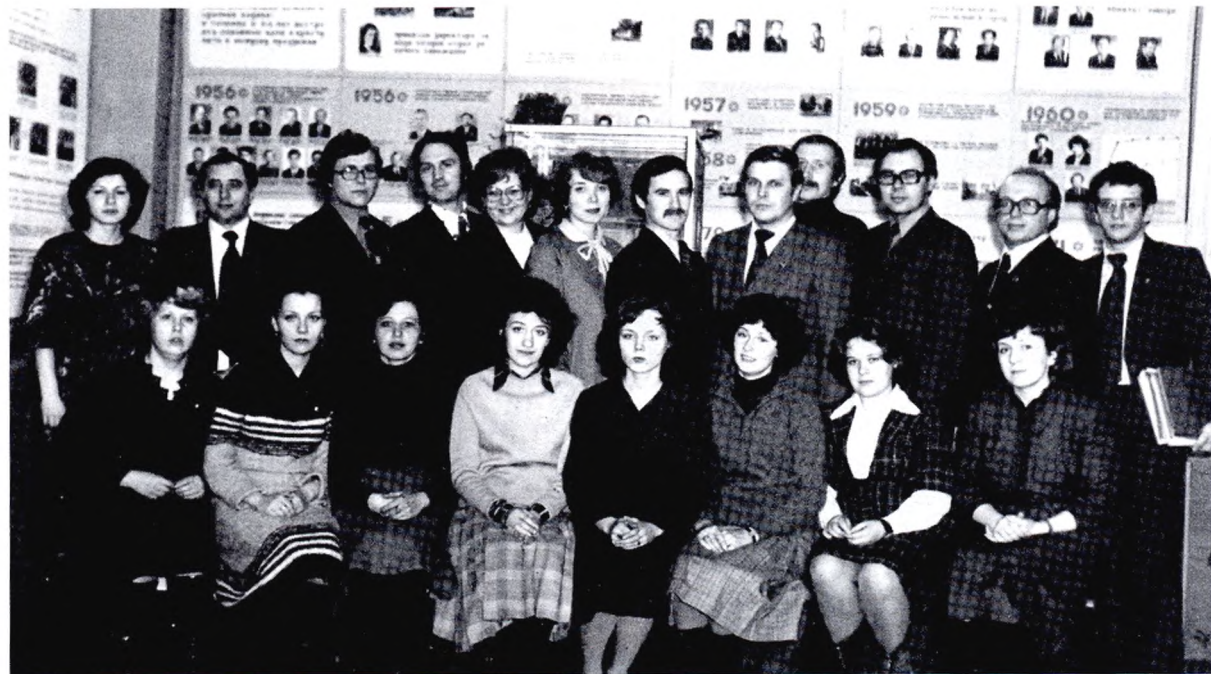
Актив городской комсомольской организации