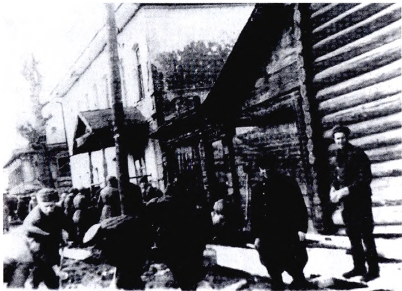
Первый воскресник в п. Нижняя Тура 24 октября 1948 г.