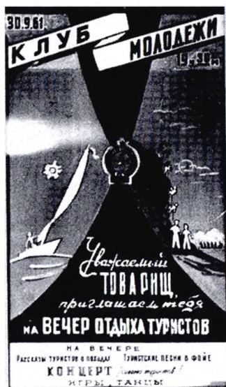
Пригласительный билет в клуб молодежи (30.09.1961 г.)