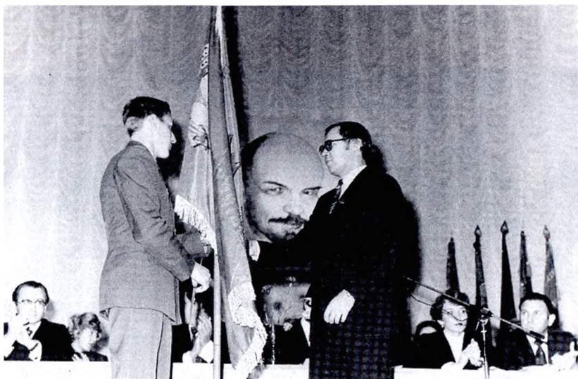
Вручение Лесной городской комсомольской организации переходящего знамени ЦК ВЛКСМ и МСМ СССР